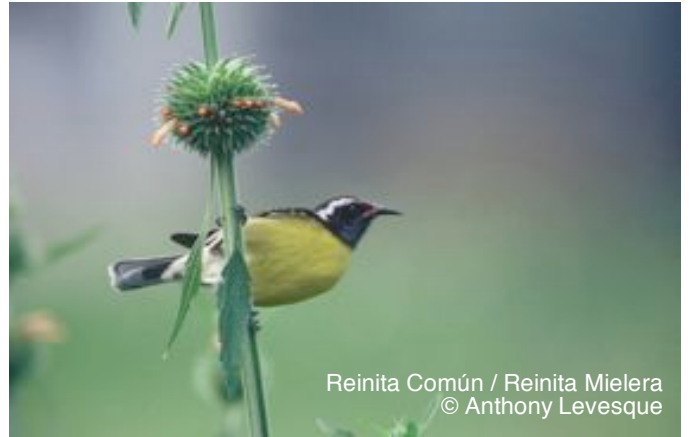
Reinita Común / Reinita Mielera

Reinita Común / Reinita Mielera ( Coereba flaveola ) es un ave común residente a través de las islas del Caribe y América Central. Ésta prospera en bosques perturbados y jardines, donde se alimenta de néctar.