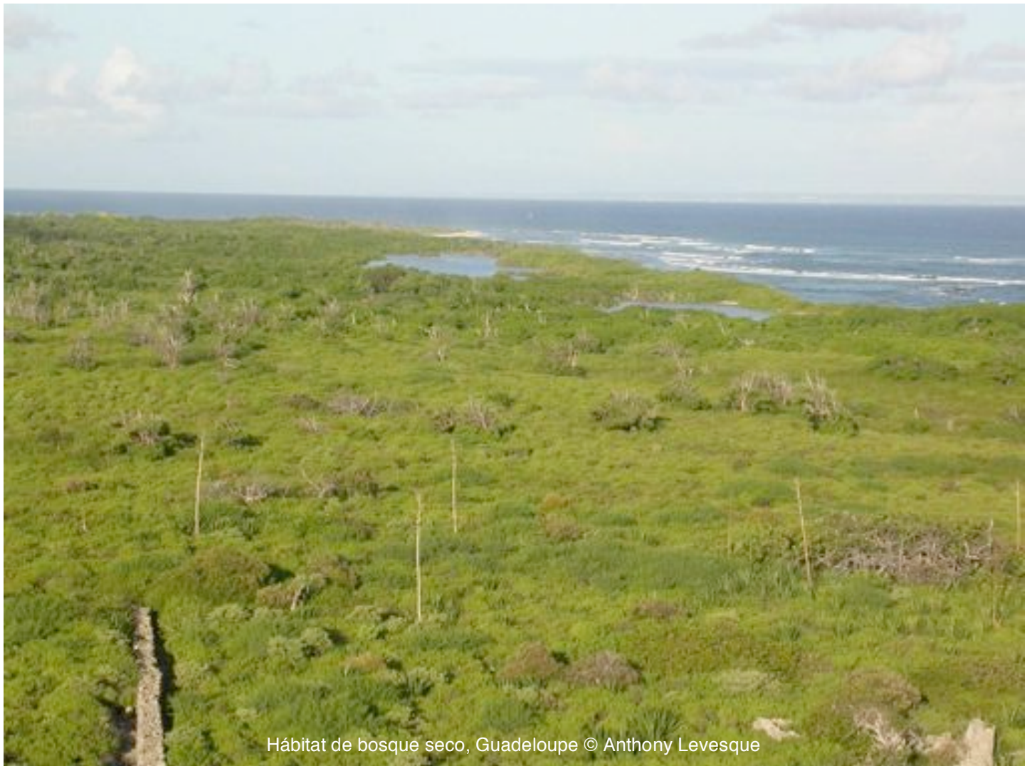
Hábitat de bosque seco, Guadeloupe