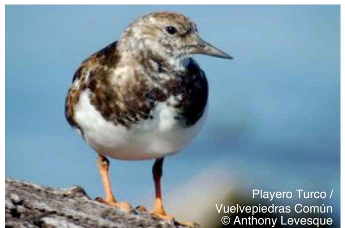
Playero Turco / Vuelvepiedras Común

Playero Turco / Vuelvepiedras Común ( Arenaria interpres ) se encuentra a lo largo de las costas rocosas de la mayoría de las islas. Cría en la tundra Ártica e inverna en el sur. Toma su nombre de la forma en que se alimenta— girando piedras, despojos flotantes y otros desechos mientras busca alimento a lo largo del borde del agua.