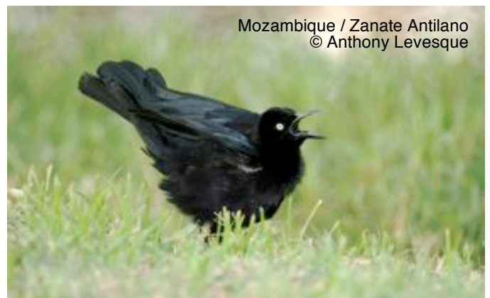
Mozambique / Zanate Antillano

Mozambique / Zanate Antillano ( Quiscalus niger ) y Zanate Caribeño ( Q. lugubris ) son comunes en jardines a través de la región. Estos son sociables y omnívoros, y también puede tomar la comida de la mesa de un hotel.