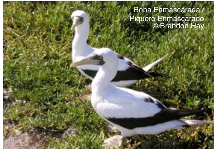
Boba Enmascarada / Piquero Enmascarado

Enmascarado ( Sula dactylatra ) es un ave marina tropical que anida en islas cercanas a la costa o cayos y se alimentan de peces en el océano. Sus números están disminuyendo por la pérdida de hábitat. Sólo se conocen siete colonias de anidaje en el Caribe.