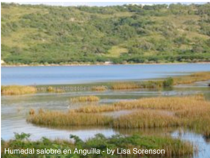
Humedal salobre en Anguilla

Los hábitats costeros del Caribe incluyen: humedales (manglares, ciénagas, marismas y bosques de pantanos), playas y costas (playas arenosas y dunas, costas rocosas, acantilados, cayos, bosques costeros y matorrales) y hábitats marinos (pantanos y orillas, arrecifes, yerbas marinas y mar abierto). Estos hábitats son importantes para la protección costera ante las tormentas y para la productividad marina. Muchas de las especies de playeros residentes y migratorios, aves zancudas, patos y aves marinas dependen de ellos.