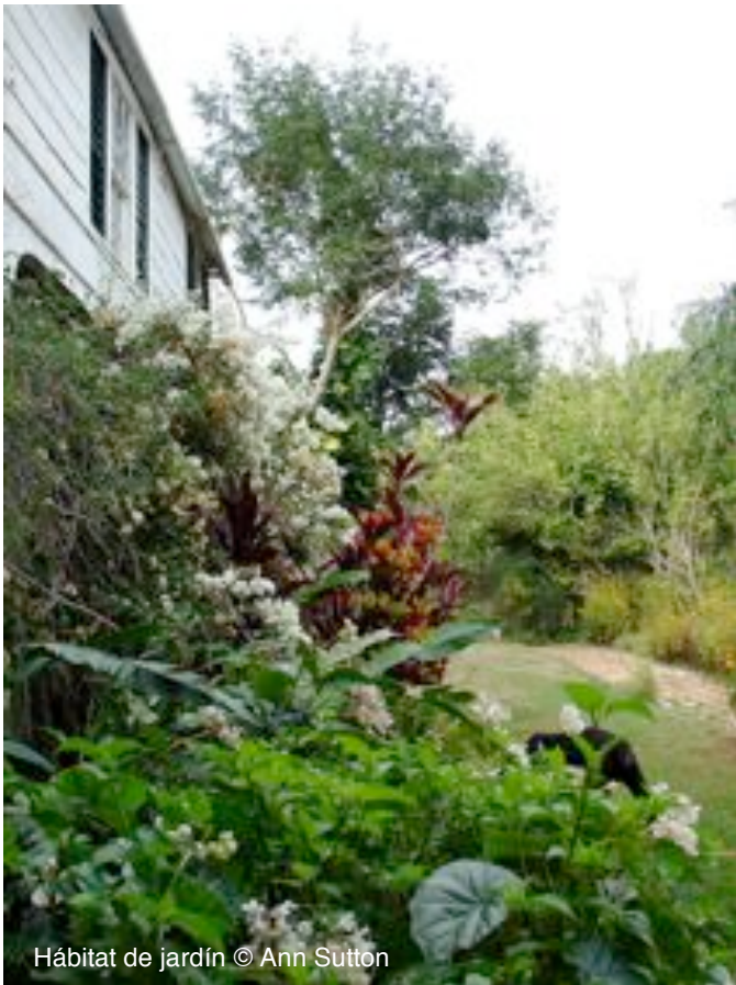
Hábitat de jardín

En muchas de las islas más pequeñas, como Barbados, permanece muy poca vegetación natural. El bosque original, los humedales y prados han sido convertidos a espacios para la caña de azúcar, pastos, residencias, hoteles, plantaciones de bosque e industrias. Muchas aves del Caribe se han adaptado a sobrevivir estos cambios. Podemos realizar muchas cosas para aumentar la calidad de hábitat perturbado para las aves.