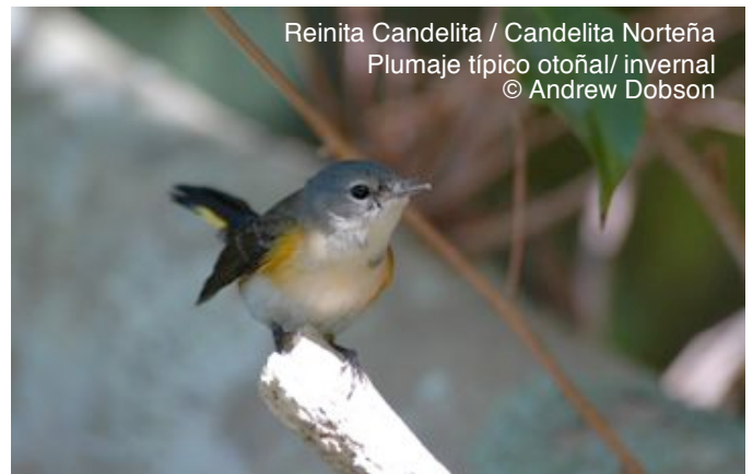
Reinita Candelita / Candelita Norteña Plumaje típico otoñal/ invern

Reinita Candelita / Candelita Norteña ( Setophaga ruticilla ) es una de las especies más comunes durante el invierno en el Caribe, cuando ésta se puede ver, se encuentra en casi todos los sitios donde haya árboles y arbustos, e. ej., plantaciones de café de sombra. Se reproduce en Norte América, y escapa del tiempo frío migrando hacia el Caribe.