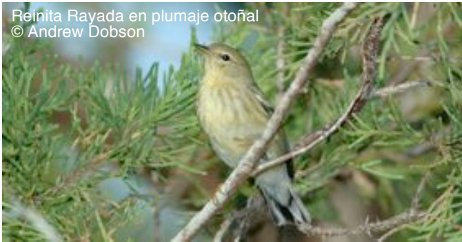
Reinita Rayada en plumaje otoñal

Reinita Rayada ( Dendroica striata ) anida en hábitats de bosques boreales en Norteamérica. Durante octubre y noviembre, prácticamente toda la población mundial migra a través de las Antillas Menores en su viaje invernal hacia Suramérica. Utiliza una variedad de bosques, bosque de arboleda y hábitats de matorrales durante la migración..